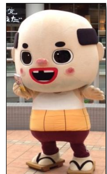
尼崎非公認ゆるキャラ ちっちゃいおっさん