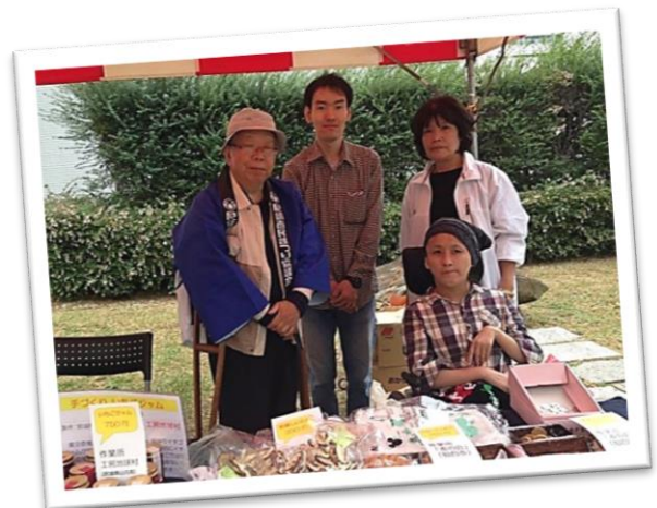
昨年の市民まつりにて